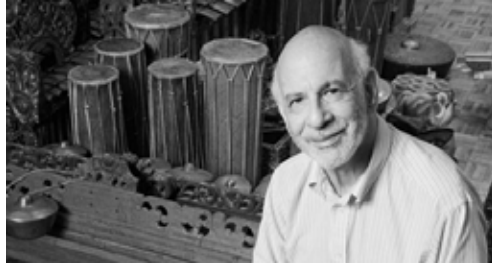
ბრუნო ნეტლი აშშ