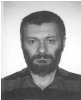
ზაალ წერეთელი საქართველო